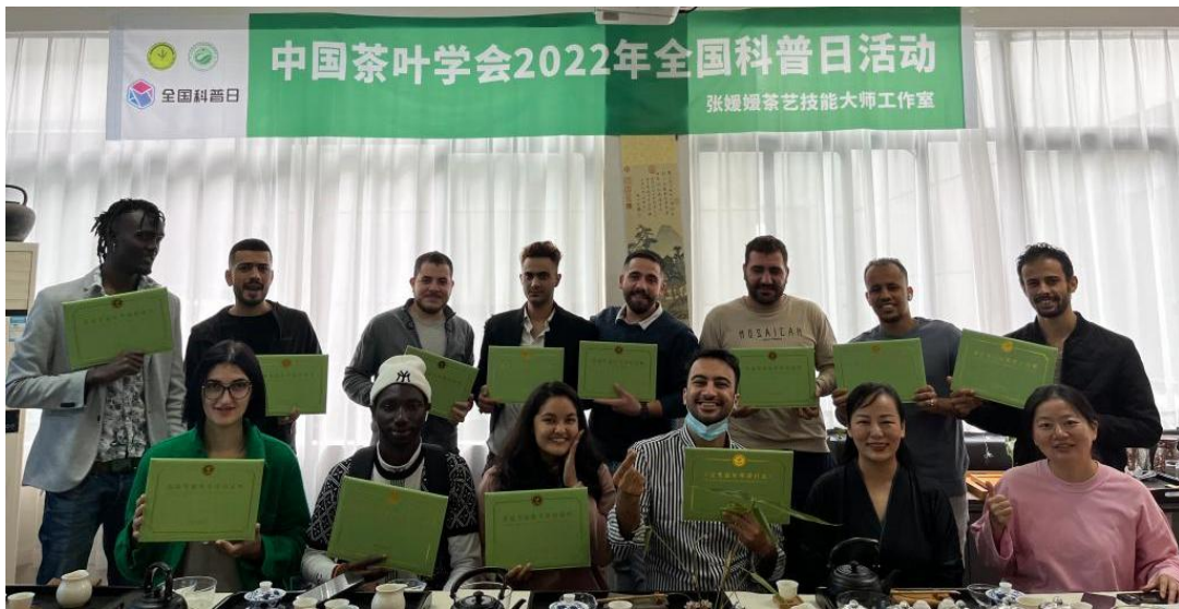
图 5-1 学校国际学生获中国茶业专业技能水平评价证书

学校重点建设中欧（西班牙）跨境电子商务培训学院、中欧（西班牙）跨境电子商务培训学院，对接“一带一路”沿线国家和地区青年学子技能培训需求，推出创业教育、电商直播、中国（义乌）商贸文化、产品设计训练营等具有本土特色的培训课程，吸引了义路同行-全球青年创业培训计划、阿拉伯国家电子商务合作研修班、义乌外籍人士网络直播培训班等学员来校学习。在共建“一带一路”向高质量发展转变这一背景下，学校境外培训也进入从“做大”到“做强”“做好”的提质增效新阶段。学校依托电商创业实践基地及全国跨境电商教育发展联盟等平台，开展电子商务类及创业类培训，为欧洲尤其在西班牙的华商企业和个人提供优质的跨境电商培训服务。