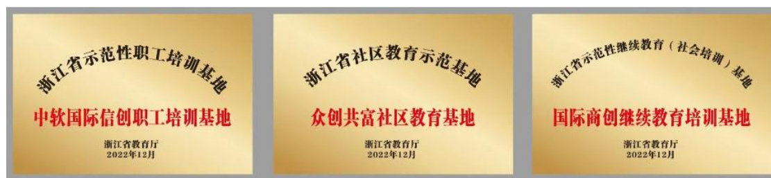
图 3-2 浙江省服务终身学习示范性基地