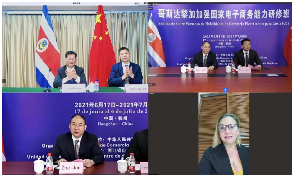
图 5-2 哥斯达黎加国家电子商务能力研修班开班仪式